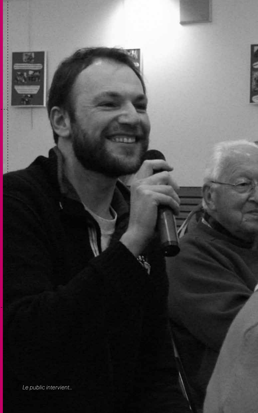
Le public intervient...