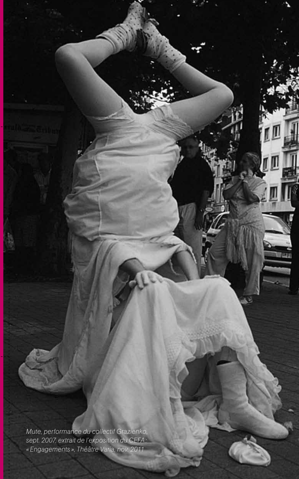
Mute, performance du collectif Grazienko, sept. 2007, extrait de l'exposition du CEFA : « Engagements », Théâtre Varia, nov. 2011