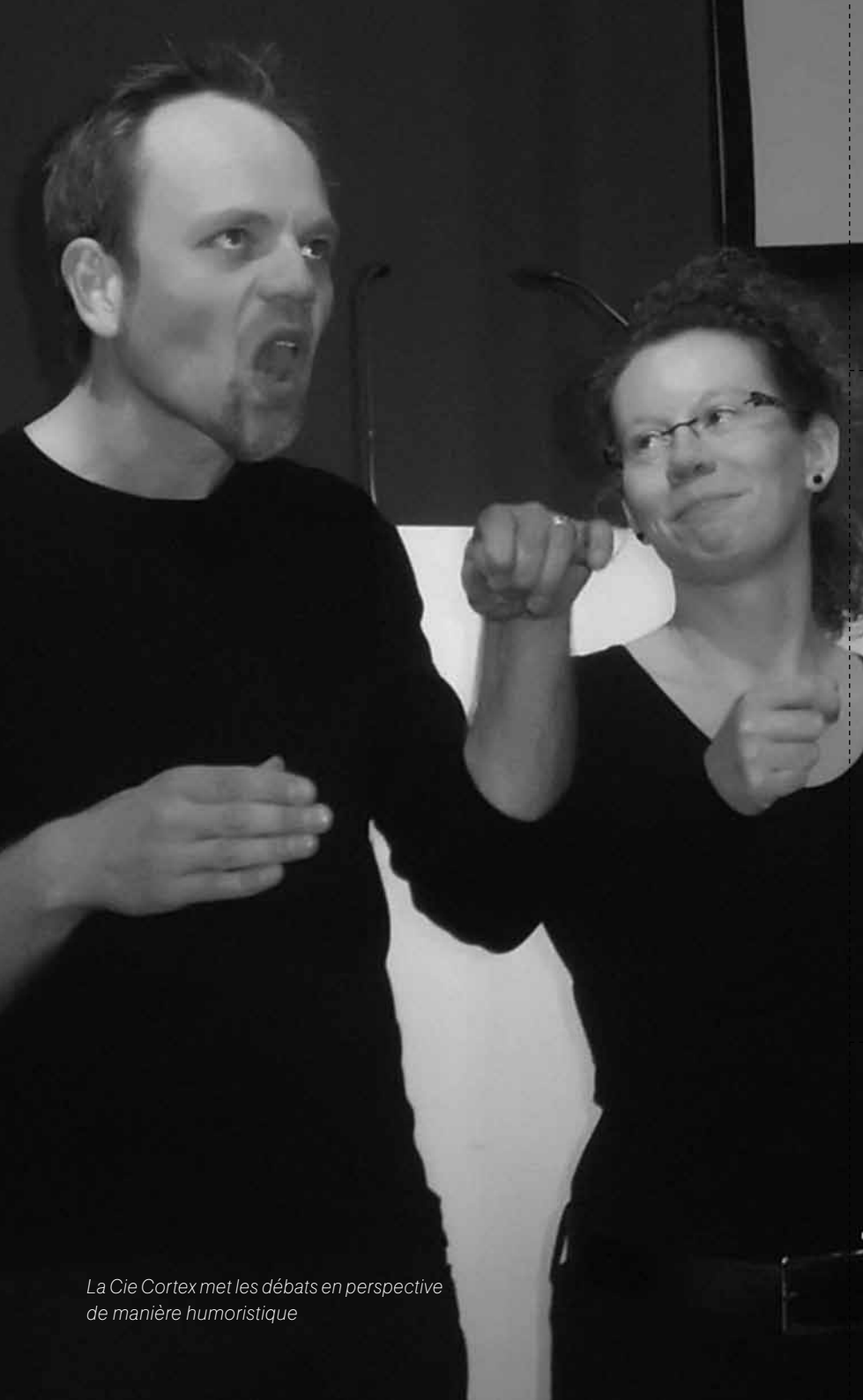
La Cie Cortex met les débats en perspective de manière humoristique